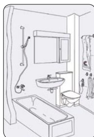
WC-modul og vinkelsjakt