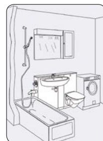
S- og WC-modul med VM-tilkobling