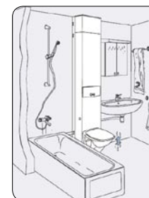
K47 standard, midtplassert