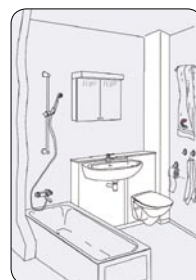
S-modul, WC-modul og Vinkelsjakt