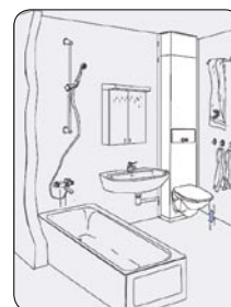
K47 standard, hjørneplassert