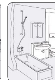
K60 standard og S-modul