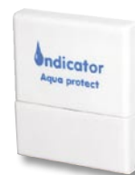
Indicator i viloläge